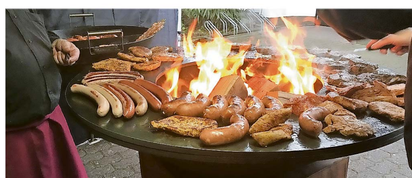
Jede Menge Grillgut, aber auch Beilagen, gibt es beim Gudd-Zweck-Extrem-Grillen in Oberkirchen.

Eine Teilnahme ist nur nach Anmeldung bei Erwin Raddatz möglich, um den Dokumentationspflichten zu genügen. Raddatz teilt dann die Schwenker und Pavillons gemäß den geltenden Sicherheitsbestimmungen den angemeldeten Familien/Haushalten/Gruppen zu.