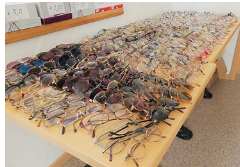
Wer so viele Brillen von vielen aktiven Helfern/Unterstützern („mitmachende“ Optiker, Möbelhäusern, Schulen, Gemeinden, Städte ... usw. ..) aus ganz Deutschland regelmäßig zugeschickt bekommt, der muss auch in der Lage sein, diese Brillen-Menge zu „verarbeiten“, zu reinigen, so sortieren und vor allem nach Dioptrien zu „vermessen“....